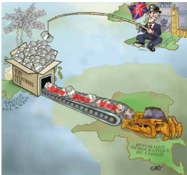
Caricature 'Hors d'Afrique' réalisée par Damien Glez.

Les IVB – la juridiction de prédilection de Gertler – sont très souvent qualifiées de paradis fiscal. En outre, elles fournissent aussi des garanties d'anonymat. Lorsque la Banque mondiale a examiné plus de 200 cas de corruption à grande échelle, plus de 70 pour cent concernaient au moins une société anonyme utilisée pour chercher à masquer les propriétaires réels et à faciliter leurs forfaits. Les Territoires britanniques d'outre-mer étaient les juridictions les plus utilisées ; les IVB prises isolément figuraient au deuxième rang sur la liste. 33