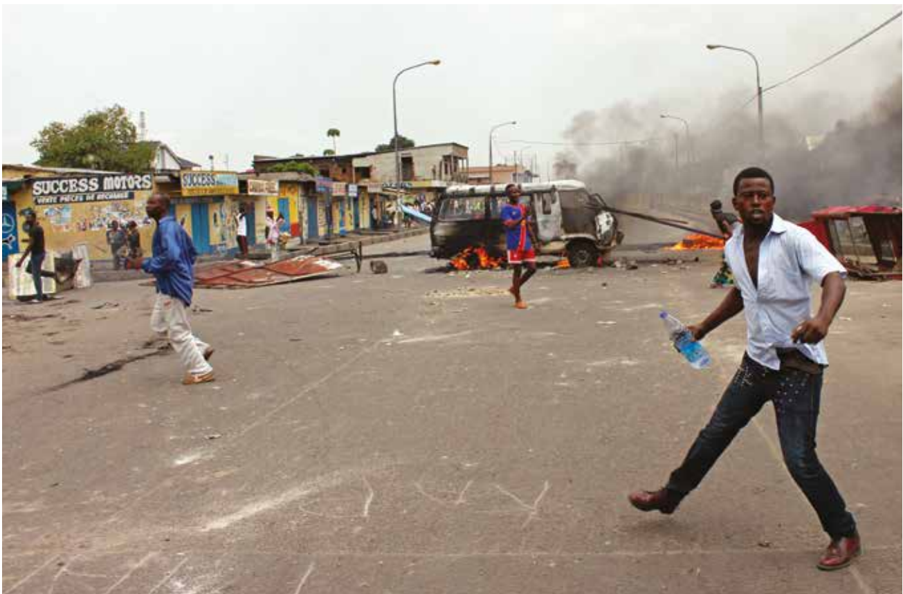
Des manifestants antigouvernementaux lors d'une manifestation contre une nouvelle loi qui pourrait reporter le scrutin présidentiel de 2016, Kinshasa, République démocratique du Congo, janvier 2015.

Les risques sont tout à fait réels de voir les progrès limités opérés par le Congo connaître un recul à l'approche des élections si des transactions telles que celles-ci sont conclues sans un contrôle approprié.