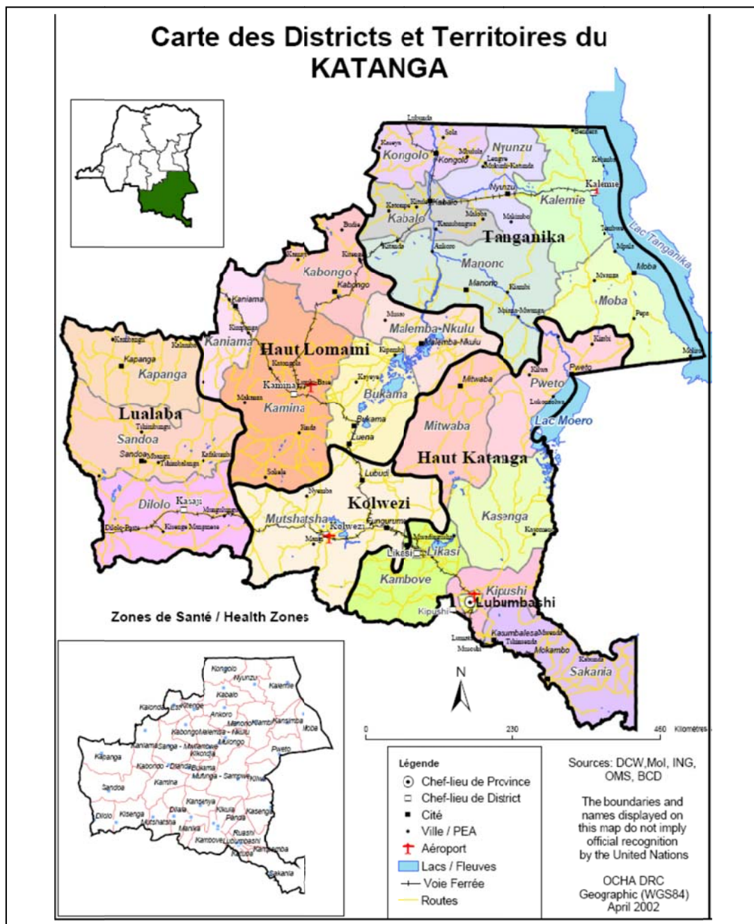
Figure 1.1. Carte politique de la province du Katanga