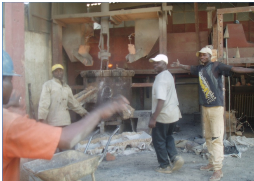
Figure 4.9. Opérateurs au four à arc sans tenue de protection

La photo de la figure 4.9 montre les opérateurs d'un four à arc travaillant sans tenue de protection (casque, gants, tenue ignifuge, chaussure de sécurité, etc.). Cette situation est observable dans plusieurs entreprises de la catégorie C. Comme conséquence beaucoup d'accidents sont rapportés : brûlure aux acides, blessures dues aux chutes d'objets ou aux projectiles, etc.