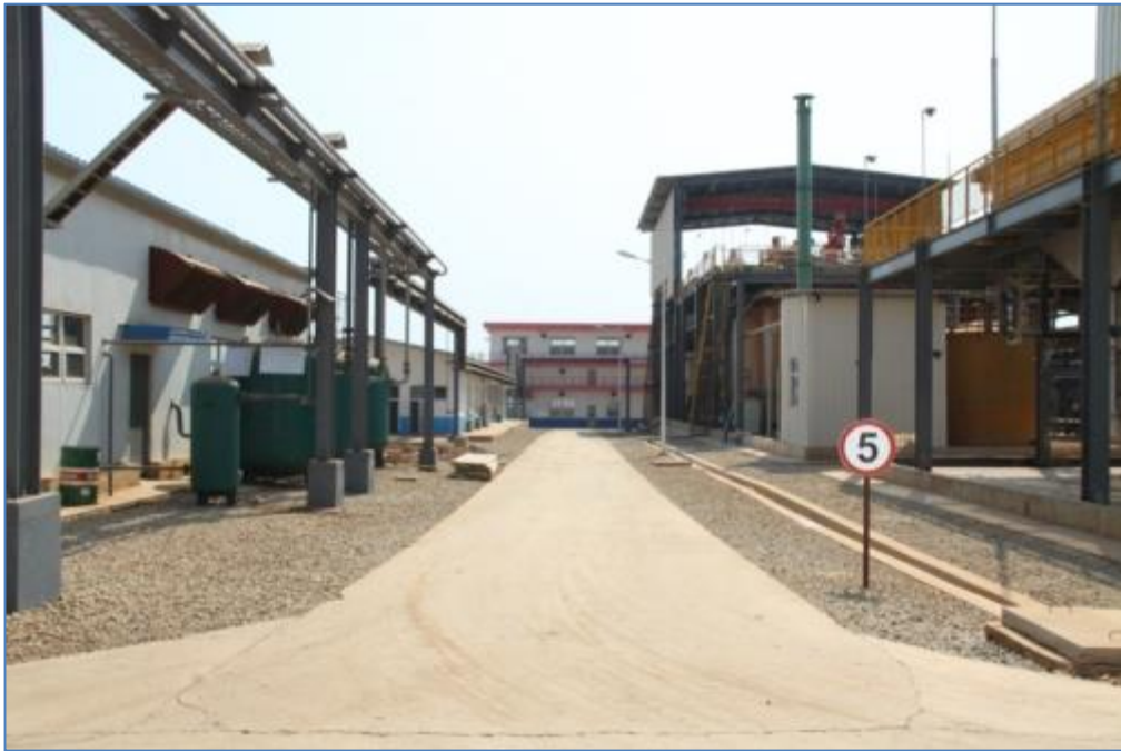
Figure 4.3. Limitation de vitesse au sein de l'usine de COMILU