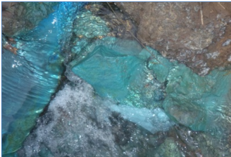
Figure 4.7. Eaux usées colorées provenant des usines hydrométallurgiques

Toujours en ce qui concerne les entreprises qui opèrent par voie hydrométallurgique, comme on peut le voir sur la photo de la figure 4.7, on constate parfois que les eaux sont colorées, ce qui témoigne de la présence des métaux en concentration importante.