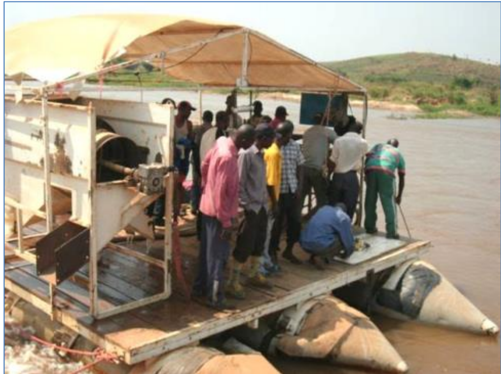
Figure 2.2. Vue d'une drague de la MIBA

Les diamants extraits par ces deux types d'exploitation sont vendus aux négociants et aux comptoirs d'achat agréés.