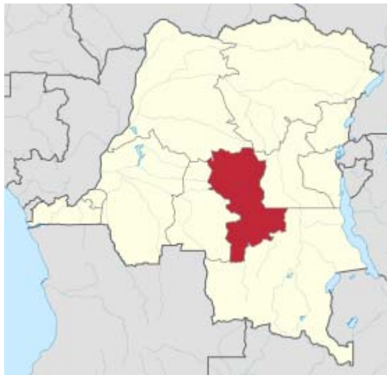
Figure 2.1. Localisation de la province du Kasai-Oriental sur la carte de la RDC

La province du Kasai-Oriental a été créée par ordonnance n°66/205 du 6 Avril 1966. Elle est située au centre du pays, entre les parallèles 1°43' et 8° de latitude sud et entre les méridiens de 21°47' de longitude Est. Elle est limitée au Nord par les provinces de l'Equateur et Orientale, à l'Est par la province du Maniema, au sud par le Katanga et à l'Ouest par le Kasai-Occidental.