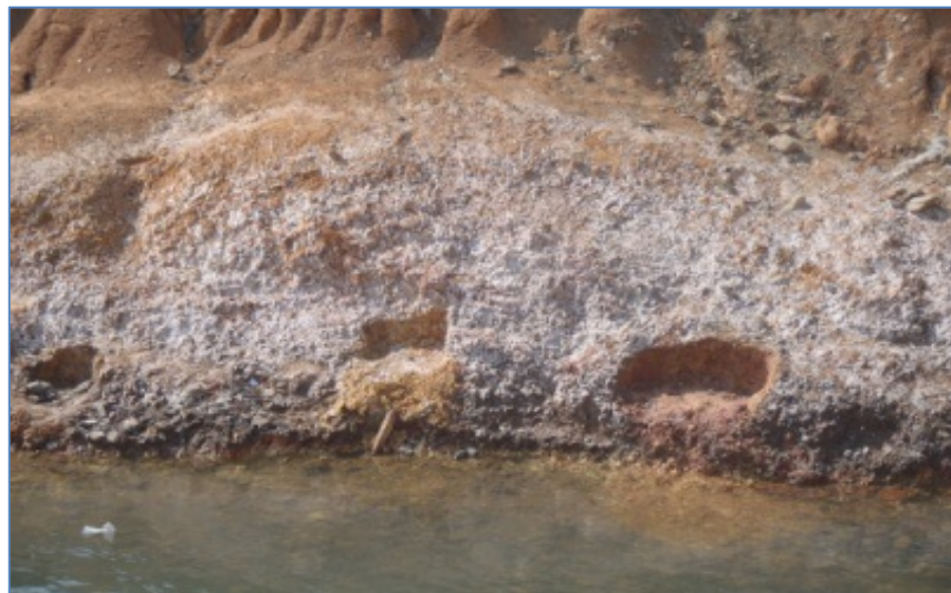
Figure 4.5. Dépôt rosâtre sur le drain d'évacuation des eaux usées

En ce qui concerne les entreprises qui opèrent par voie hydrométallurgique, on observe sur les bords des drains d'évacuation des eaux usées un dépôt blanchâtre ou rosâtre. Ce dépôt est signe de pollution avérée.