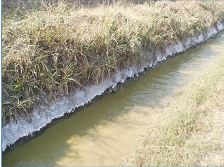
Figure 4.6. Dépôt blanchâtre sur le drain d'évacuation des eaux usées des usines hydrométallurgiques

Toujours en ce qui concerne les entreprises qui opèrent par voie hydrométallurgique, comme on peut le voir sur la photo de la figure 4.7, on constate parfois que les eaux sont colorées, ce qui témoigne de la présence des métaux en concentration importante.