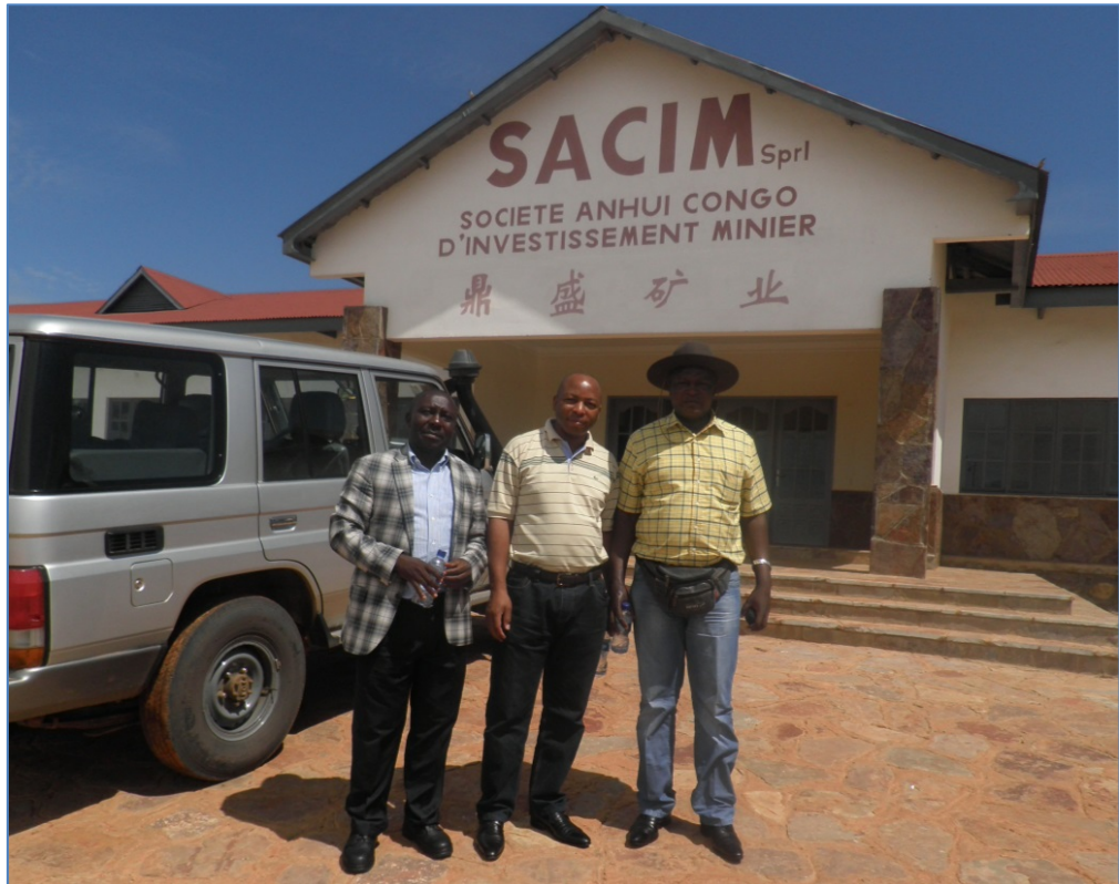
Figure 5.1. Photo de notre passage à SACIM