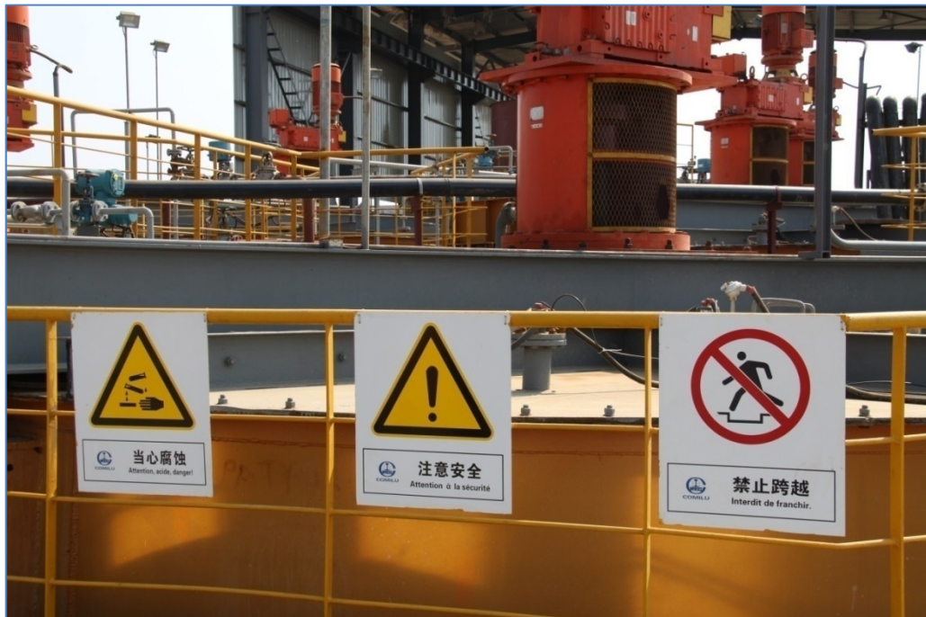
Figure 4.2. Panneaux de signalisation au sein de l'usine de COMILU

Les photos des figures 4.2 à 4.4 montrent respectivement, une vue de l'intérieur de l'usine en construction avec les panneaux de signalisation, une piste de circulation au sein de l'usine avec un panneau de limitation de vitesse et enfin un parc à rejet protégé par des géomembranes.