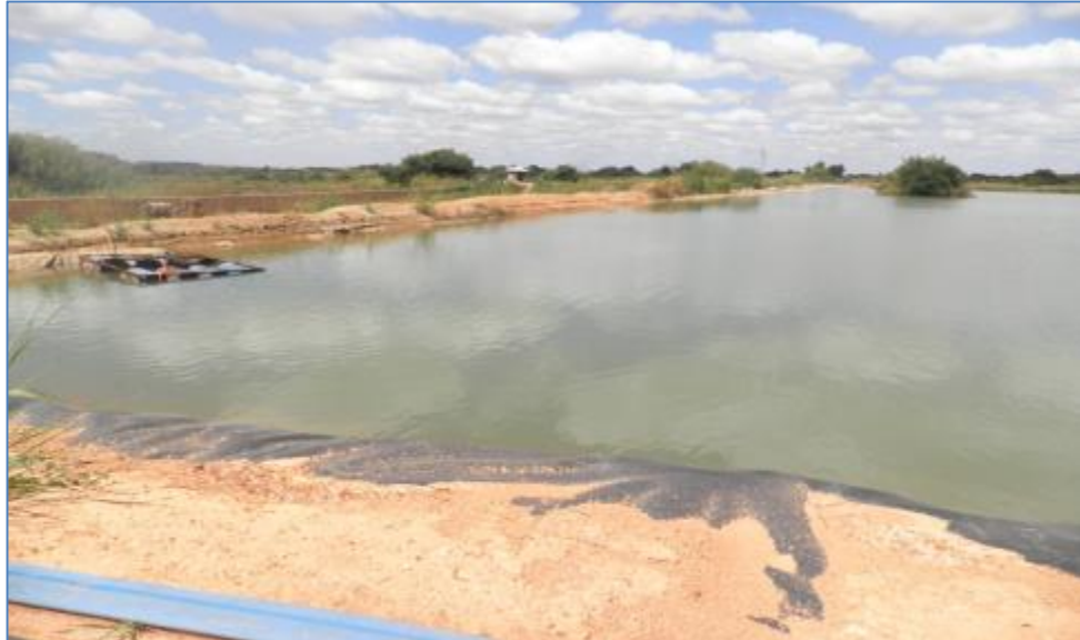
Figure 4.8. Bassins contenant les effluents liquides et rendus étanches à l'aide d'une géomembrane à l'usine de Ruashi mining

La situation est nettement contrastée en ce qui concerne les grandes entreprises (catégorie A et B). Pour cette catégorie d'entreprise, les effluents liquides sont contenus dans des bassins rendus étanches à l'aide des géomembranes (voir photo de la figure 4.8).