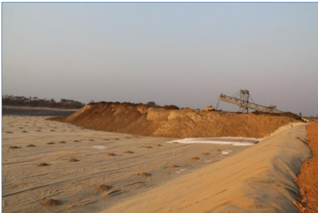
Figure 4.4. Parc à rejet protégé par des géomembranes sur le site de COMILU