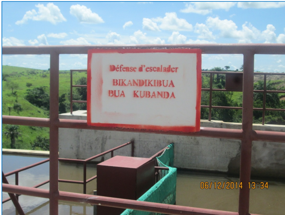
Figure 5.3. Panneaux en français et tshiluba dans une zone fréquentée aussi par les chinois

Par rapport aux congolais, les chinois bénéficieraient d'un bon salaire. Un cuisinier chinois toucherait près de 2.800 USD alors que le salaire d'un ingénieur congolais est parfois inférieur à 500 USD. Le barème salarial pratiqué par SACIM représente celui qu'avait pratiqué SENGAMINES divisé par deux. Il semble que la partie congolaise aurait négocié cette révision à la baisse des salaires dans le but de convaincre le partenaire chinois à venir investir.