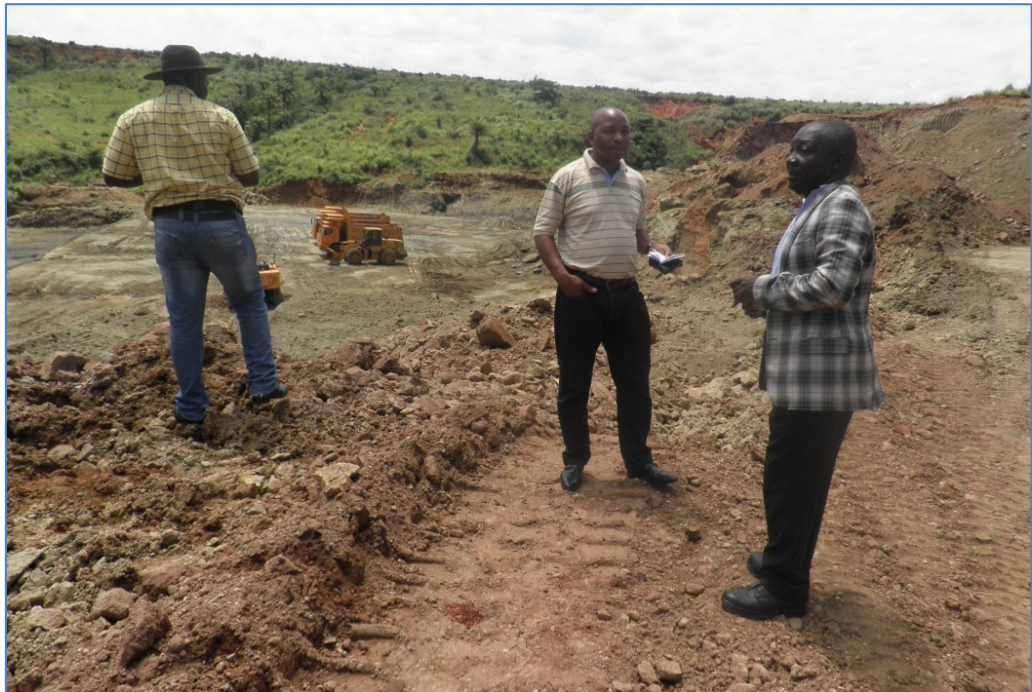
Figure 5.2. Vue de la mine de Tshibwe