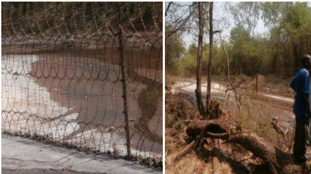
Figure 6 : Photo montrant les limites externes entre la concession de l'entreprise et celle des habitants du village

appartenant à la communauté locale par les fils barbelés. A vocation agricole, avec des terres arables et fertiles, le village a des terres arables, fertiles et favorables aux cultures vivrières (manioc, maïs, arachide, soja, haricot,...) ainsi que les cultures maraichères (chou de chine, gombo, tomate, amarante, ...).