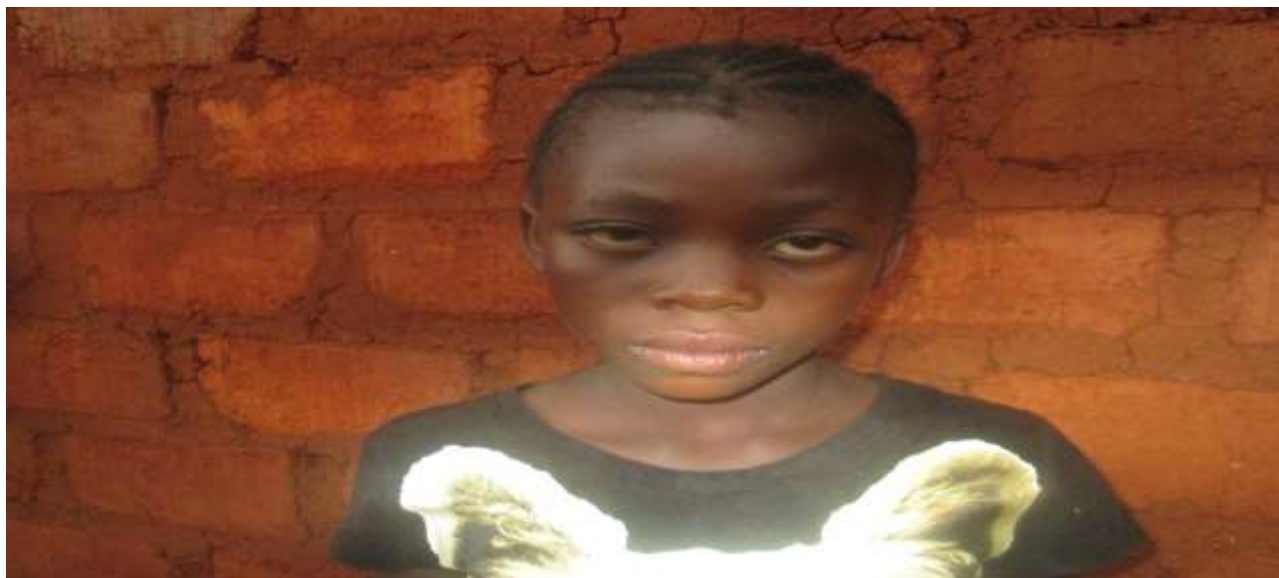
Figure 2 : LES YEUX COLORES D'UNE DES VICTIMES

Outre les bruits sonores, les poussières générées par les explosifs seraient à la base de certaines maladies dans la zone.