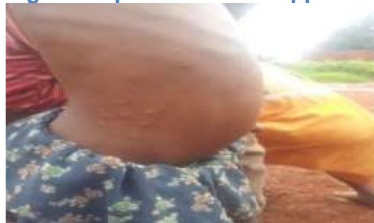
Figure 4 : phase débutant