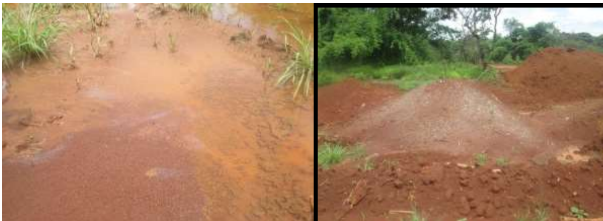
Figure 7 : Site impacté en réhabilitation

Depuis ces incidents survenus en 2013, l'entreprise n'avait entrepris aucune action ni pour réhabiliter le site affecté ni pour dédommager les agriculteurs pour leurs champs et produits, ni le village pour les dommages causés à la terre et à l'environnement. C'est grâce aux actions de l'ONG CAJJ qu'en 2015, l'entreprise a commencé la réhabilitation du site et indemnisation des agriculteurs. Il y a lieu de signaler que le chef coutumier de ce village continue à réclame des réparations collectives pour les dommages causés à sa terre et sa forêt.