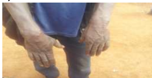
Figure 3 : phase de développement