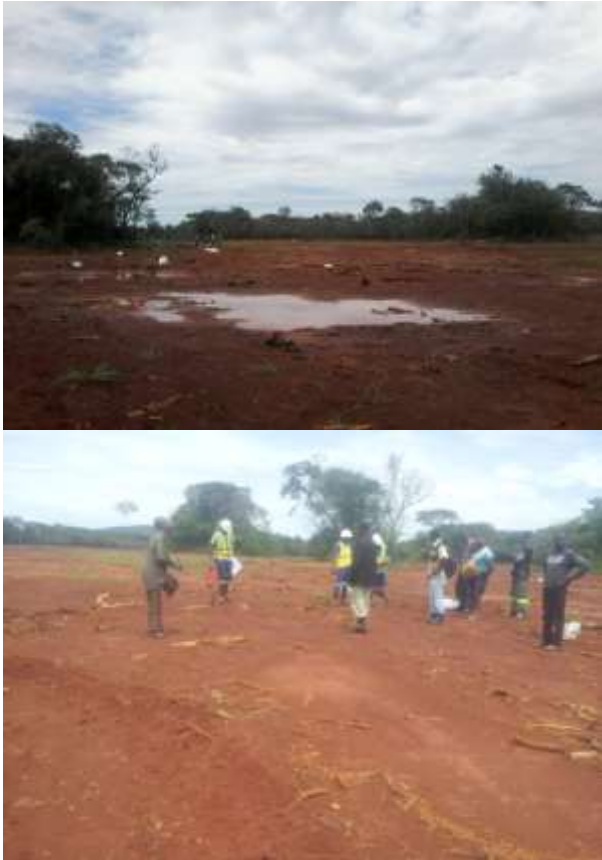
Figure 9 : Réhabilitation du site endommagé

A titre d'exemple, les résultats des analyses des prélèvements du sol faits sur le site dit réhabilité ont indiqué un PH toujours \leq 3 (inférieur ou égale à 3) ce qui confirme encore l'acidité du sol et par conséquent l'absorption des éléments minéraux sera difficile dans le sol et entrainera une croissance très difficile des végétaux, voir même impossible pour certains espèces.